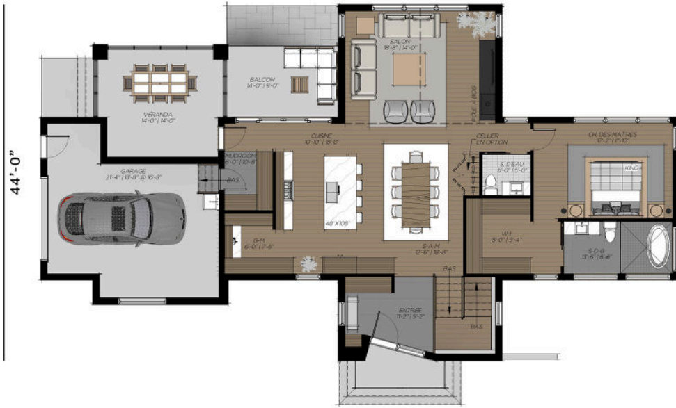
PLAN DU REZ-DE-CHAUSSÉE 1609 PI.CA.