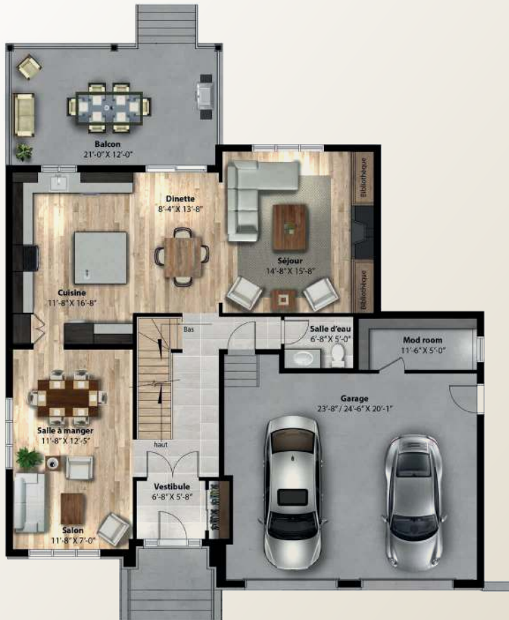
PLAN DU REZ-DE-CHAUSSÉE 1 097 PI.CA.