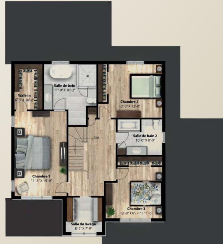
PLAN DE L'ÉTAGE 1 156 PI.CA.

SUPERFICIE DE 2 253 PI.CA. | GARAGE 614 PI.CA. | 3 CHAMBRES | 2 ½ SALLES DE BAIN | 1 SALLE DE LAVAGE