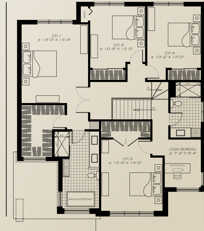
PLAN DE L'ÉTAGE