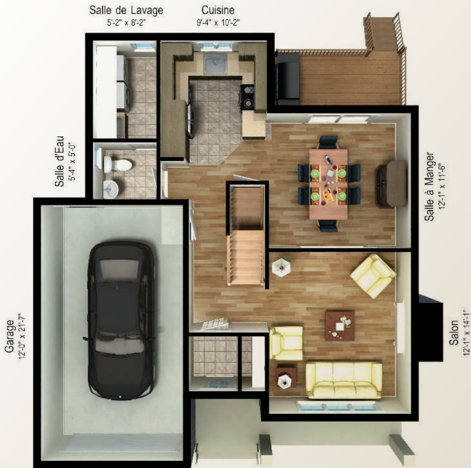
PLAN DU REZ-DE-CHAUSSÉE 686 PI.CA.