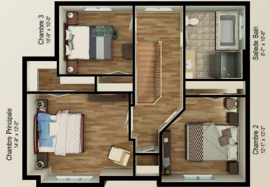
PLAN DE L'ÉTAGE 822 PI.CA.

SUPERFICIE DE 1 508 PI.CA. | GARAGE 295 PI.CA. | 3 CHAMBRES | 1 ½ SALLES DE BAIN | 1 SALLE DE LAVAGE