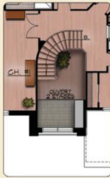
PLAN DE L'ETAGE (OPTION C-CATHÉDRALE) SUP.: 140 pl.ca. (HABITABLE) SUP.: 301 pl.ca. (TOTALE)