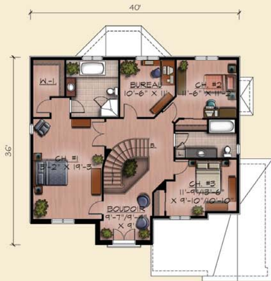
PLAN DE L'ETAGE (OPTION B-BOUDOIR) SUP.: 231 pl.ca. (HABITABLE) SUP.: 301 pl.ca. (TOTALE)

Les perspectives illustrées peuvent différer des plans de construction. Informez-vous aux conseillers en habitation. Toutes reproductions partielles ou complètes sont interdites.