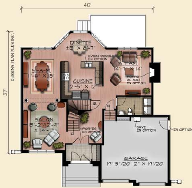
PLAN DU REZ-DE-CHAUSSEE (OPTION A & B) SUP.: 196 pl.ca. + GARAGE 442 pl.ca.