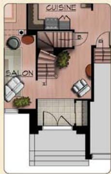
PLAN DU REZ-DE-CHAUSSEE (OPTION C-CATHÉDRALE) SUP.: 196 pl.ca. + GARAGE 442 pl.ca.