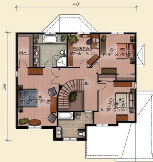
PLAN DE L'ETAGE (OPTION A) SUP.: 221 pl.ca. (HABITABLE) SUP.: 301 pl.ca. (TOTALE)