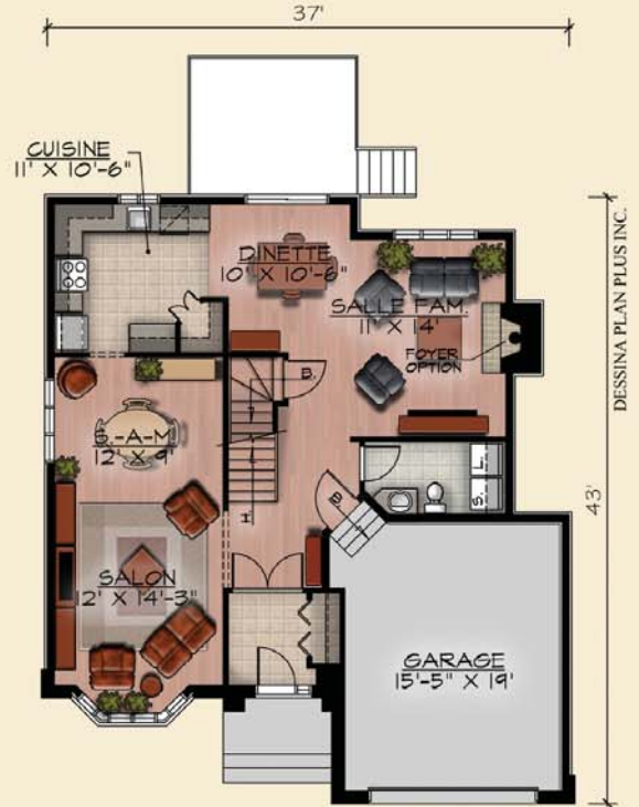
PLAN DU REZ-DE-CHAUSSEE