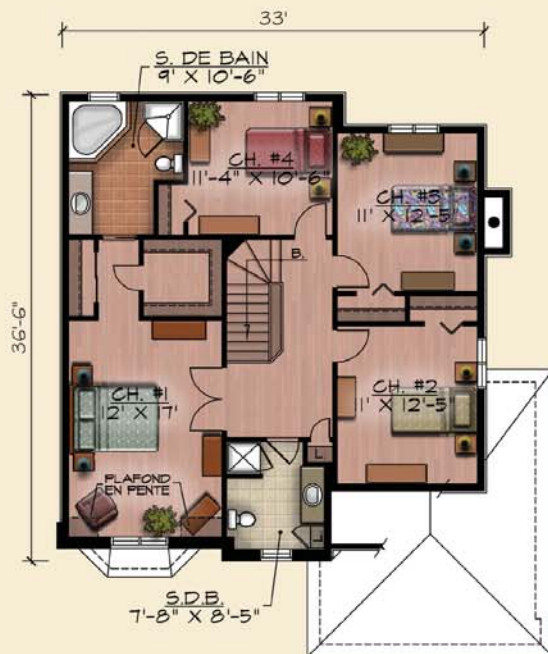
PLAN DE L'ETAGE