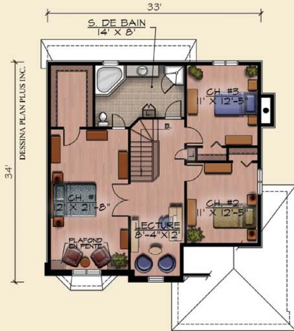
PLAN DE L'ETAGE