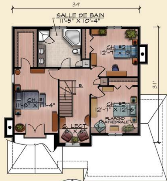
PLAN DE L'ETAGE SUP.: 1 005 pl.ca.