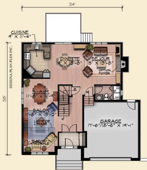
PLAN DU REZ-DE-CHAUSSEE SUP.: 1 031 pl.ca. + GARAGE 397 pl.ca.