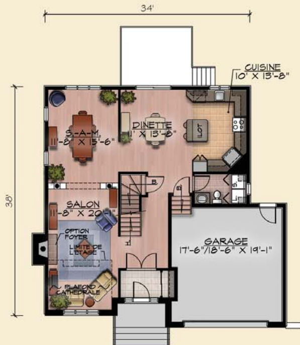
PLAN DU REZ-DE-CHAUSSEE (OPTION A) SUP.: 1 031 pl.ca. + GARAGE 397 pl.ca.